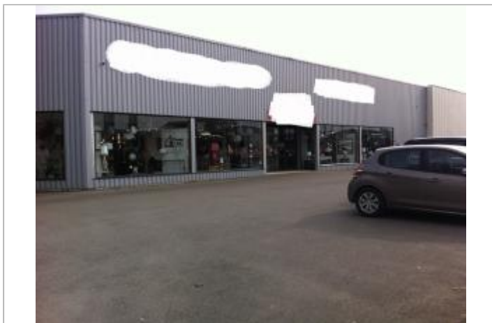
Devanture du bâtiment de commerce