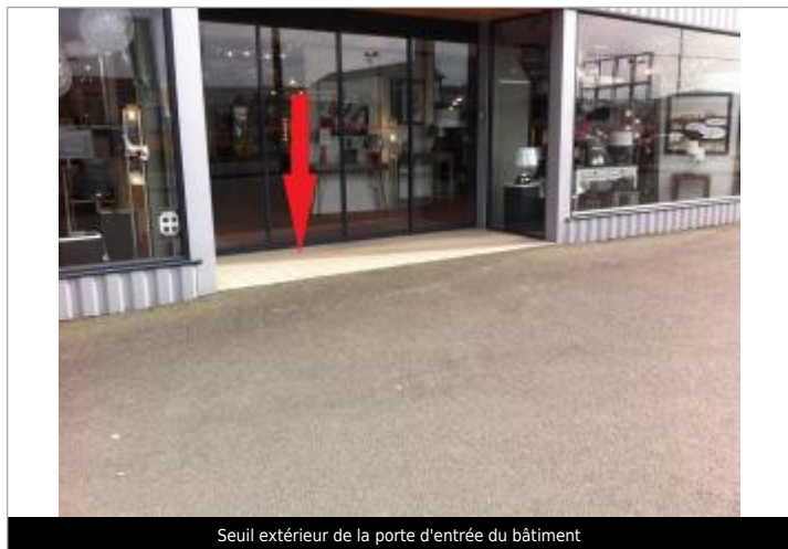
Seuil extérieur de la porte d'entrée du bâtiment