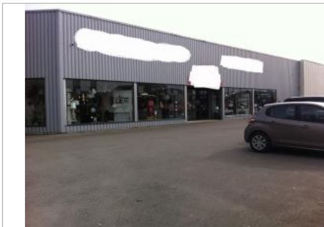
Devanture du bâtiment de commerce