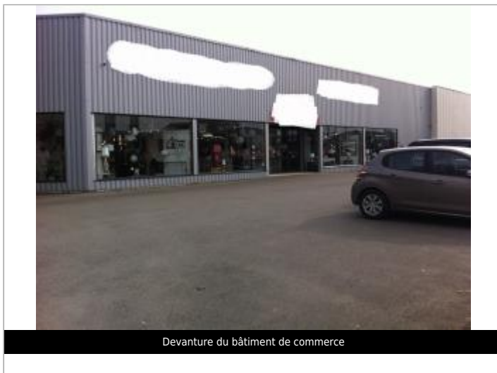
Devanture du bâtiment de commerce