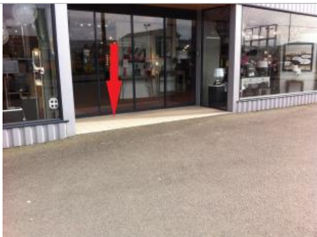
Seuil extérieur de la porte d'entrée du bâtiment

Altitude calculée de l'eau (en m) : 54.71