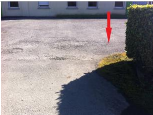
Sol ( à côté de la haie ) de la cour/du parking

Altitude calculée de l'eau (en m) : 53.36 m