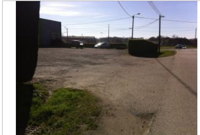
Vue d'ensemble de la cour/parking du bâtiment

Coordonnées WGS84 : X: -2.96536470 / Y: 48.03836620