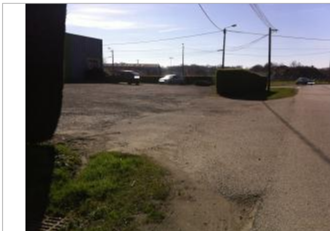
Vue d'ensemble de la cour/parking du bâtiment