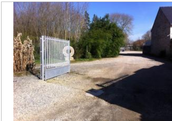
Portail d'entrée du terrain contenant le hangar

Coordonnées WGS84 : X: -2.96834290 / Y: 48.03882920