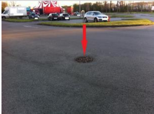
sol (au niveau de la grille avaloir)

Maximum de l'inondation : Non renseigné Visibilité : Oui État du repère : Moyen Pérennité : Aucune Repère calculé : Non PHEC : Oui