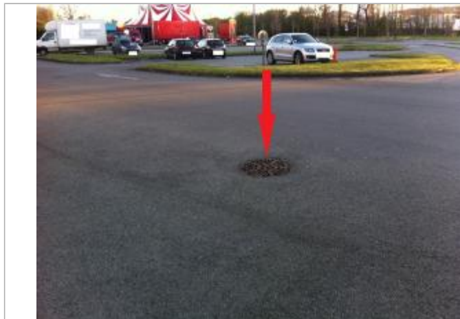
sol (au niveau de la grille avaloir)

Maximum de l'inondation : Non renseigné Visibilité : Oui État du repère : Moyen Pérennité : Aucune Repère calculé : Non PHEC : Oui