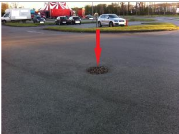
sol (au niveau de la grille avaloir)