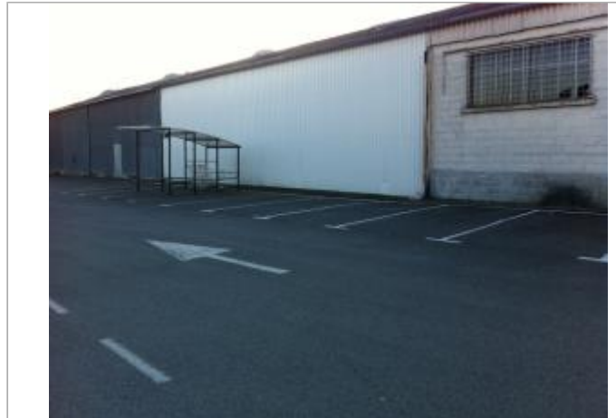
Façade du bâtiment en 2015