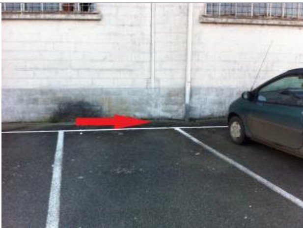
Sol à proximité de la gouttière

Système altimétrique : NGF IGN 1969 (système normal)