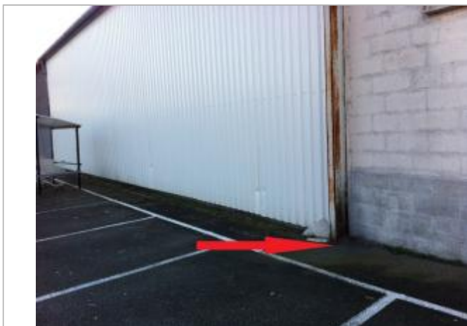
SOL (AU PIED DE L'IPN)

Différence entre le niveau d'eau et la référence (en m) : 0.000 m