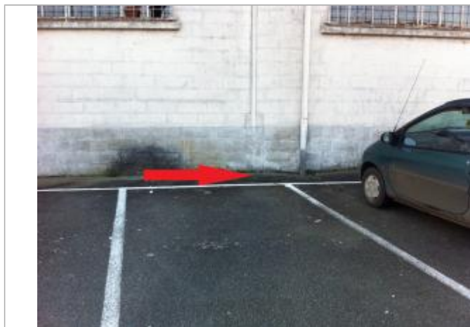
Sol à proximité de la gouttière

Maximum de l'inondation : Non renseigné Visibilité : Oui État du repère : Moyen Pérennité : Aucune Repère calculé : Non PHEC : Oui