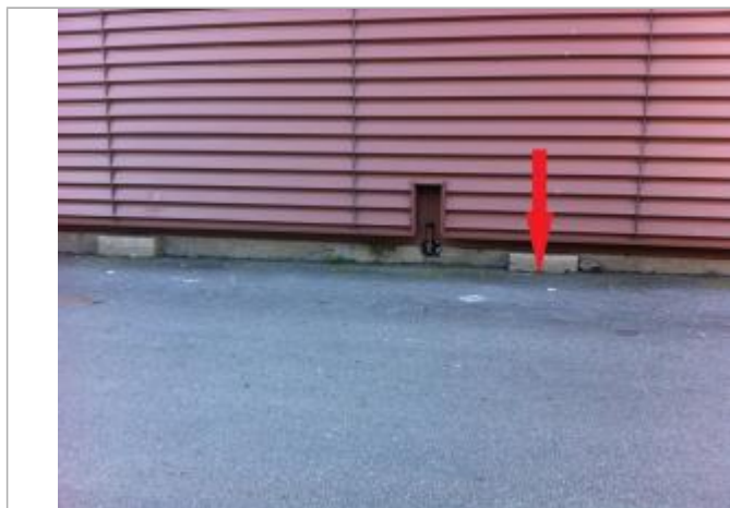
Sol au pied du mur de l'entrepôt

Maximum de l'inondation : Non renseigné Visibilité : Oui État du repère : Moyen Pérennité : Aucune Repère calculé : Non PHEC : Oui