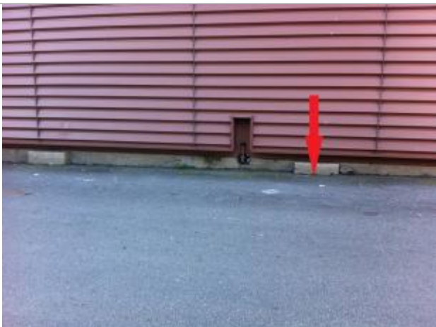
Sol au pied du mur de l'entrepôt

Altitude calculée de l'eau (en m) : 55.05