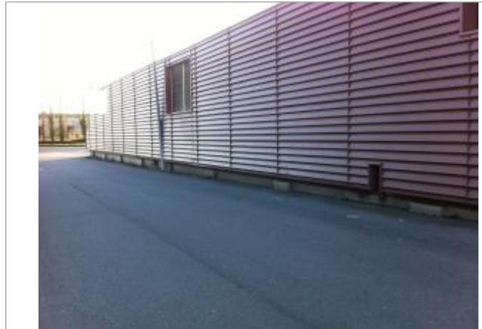
Vue d'ensemble du site