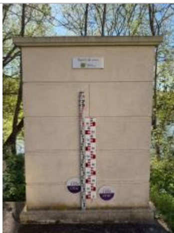
Vue des repères de crues

Altitude calculée de l'eau (en m) : 26.816 m