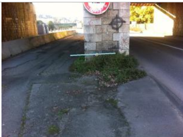
Vue d'ensemble du repère ( macaron NGF )

Altitude calculée de l'eau (en m) : 55.12 m