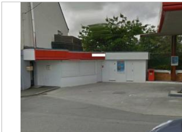
Vue d'ensemble de la station essence