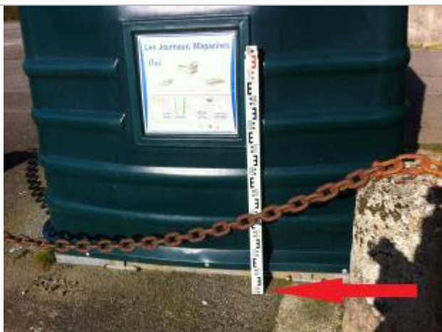
SOL (AU DROIT DU 1er CONTENEUR VERT)

Altitude calculée de l'eau (en m) : 55.21 m