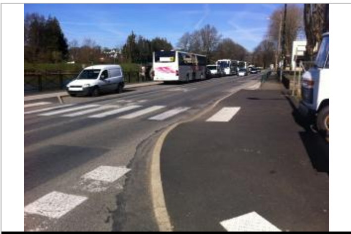
Passage piéton (traversée du quai) , QUAI DES RECOLLETS

GÉOLOCALISATION Coordonnées WGS84 : X: -2.96524490 / Y: 48.07132240 Coordonnées RGF93 (Lambert 93) X: 256135.71 / Y: 6791323.28 Coordonnées RGF93 (ETRS89) : X: -2.9652449 / Y: 48.0713224 Code Hydro: J5--0210 Rive de référence: Gauche