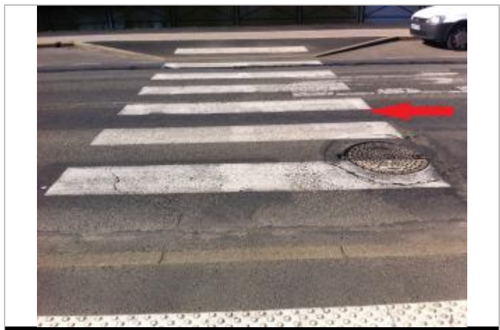
Sol / passage piéton

GÉNÉRAL Code : SPC VCB 56178-021a Date de mise à jour : 12/03/2021 Auteur : SPC VCB