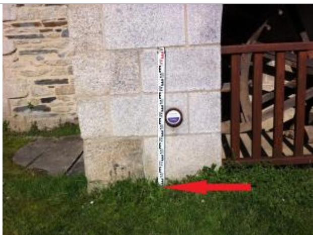
Sol (à gauche du repère)

Altitude calculée de l'eau (en m) : 56.235 m