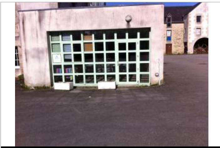
Façade de l'auberge de jeunesse

GÉOLOCALISATION Coordonnées WGS84 : X: -2.96658750 / Y: 48.07105150 Coordonnées RGF93 (Lambert 93) X: 256033.73 / Y: 6791300.81 Coordonnées RGF93 (ETRS89) : X: -2.9665875 / Y: 48.0710515 Code Hydro: J5--0210 Rive de référence: Gauche