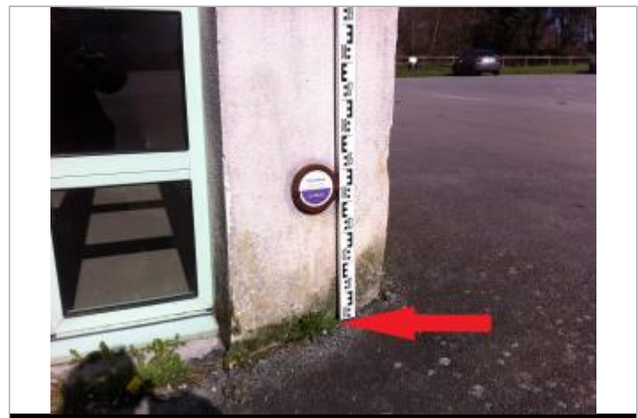
SOL (A DROITE DU REPERE)

MARQUE Maximum de l'inondation : Non renseigné Visibilité : Oui État du repère : Moyen Pérennité : Aucune Repère calculé : Non PHEC : Oui