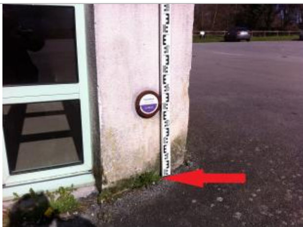
SOL (A DROITE DU REPÈRE)

Altitude calculée de l'eau (en m) : 56.28 m