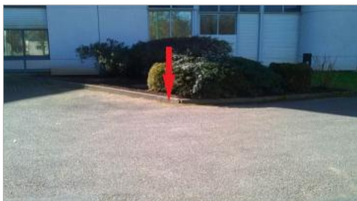
Sol au pied de la bordure droite du bâtiment

Altitude calculée de l'eau (en m) : 56.15 m