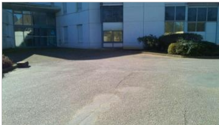
Vue d'ensemble de l'ancien hôpital (communauté Pontivy)