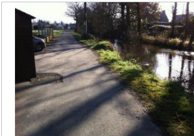
HAMEAU LA PLAGE

Coordonnées WGS84 : X: -2.97672700 / Y: 48.07477740