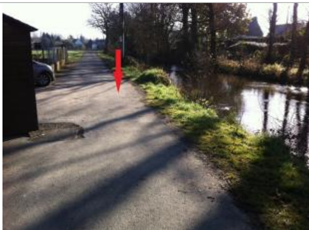
Route du hameau la plage

Altitude calculée de l'eau (en m) : 57.96 m