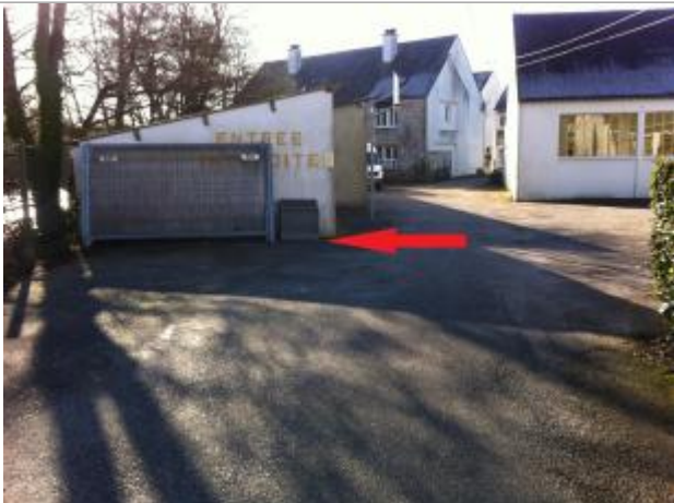
Photographie du repère

Altitude calculée de l'eau (en m) : 56.42