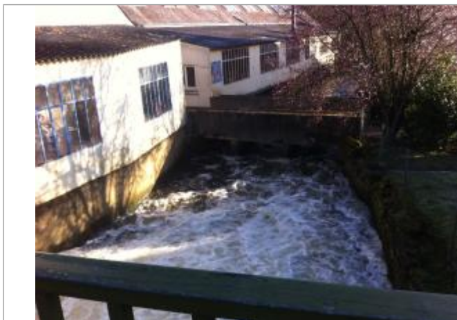
Passerelle de l'IME