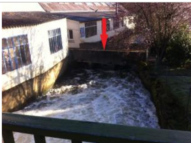
Haut du garde corps de la passerelle

Altitude calculée de l'eau (en m) : 56.69