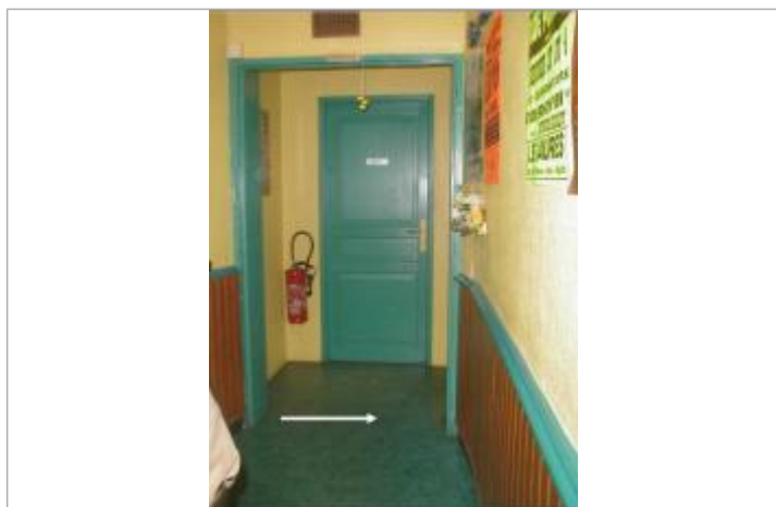
marche sous le lino du couloir du bar face en l'ancien hôpital

Système altimétrique : NGF IGN 1969 (système normal)