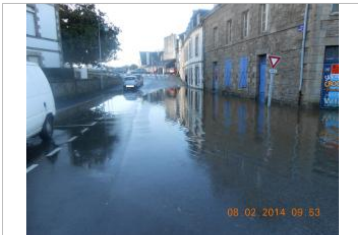
PLACE ERNEST JAN lors de l'inondation