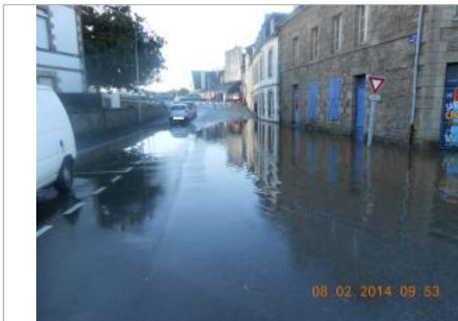
PLACE ERNEST JAN lors de l'inondation

Coordonnées WGS84 : X: -2.96798680 / Y: 48.06950680