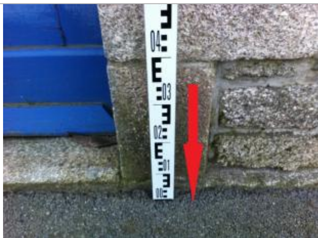
Sol au droit du mur (a proximité de la porte bleue).

Altitude calculée de l'eau (en m) : 56.2