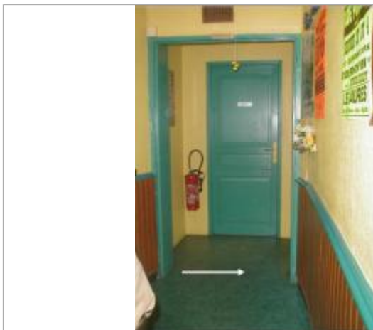
marche sous le lino du couloir du bar face en l'ancien hôpital

Système altimétrique : NGF IGN 1969 (système normal)