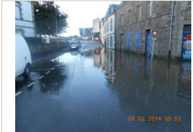
PLACE ERNEST JAN lors de l'inondation

Coordonnées WGS84 : X: -2.96798680 / Y: 48.06950680