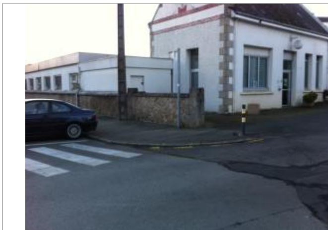
Mur d'entrée de PONTIVY Communauté 1 RUE DES MOULINS