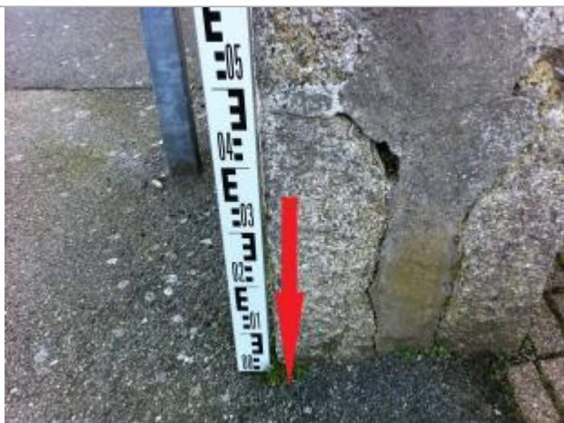
Sol au droit du mur

Altitude calculée de l'eau (en m) : 56.16