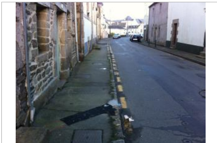
Trottoir 42 RUE DES MOULINS