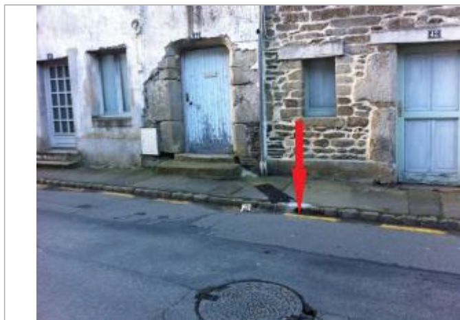
Route au droit de l'arrivée de la gouttière

Maximum de l'inondation : Non Visibilité : Oui État du repère : Moyen Pérennité : Aucune Repère calculé : Non PHEC : Non