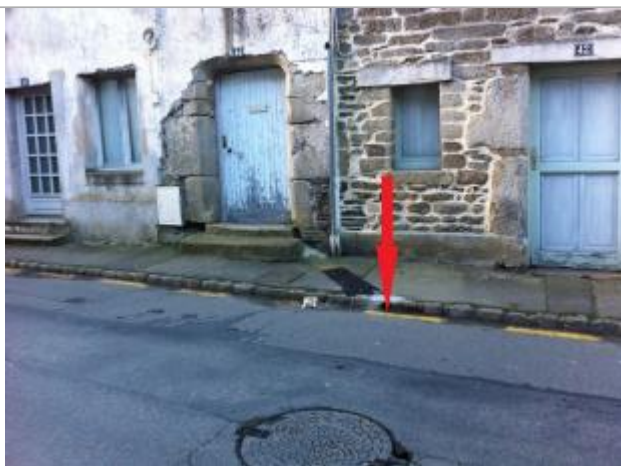
Route au droit de l'arrivée de la gouttière

Altitude calculée de l'eau (en m) : 56.01 m