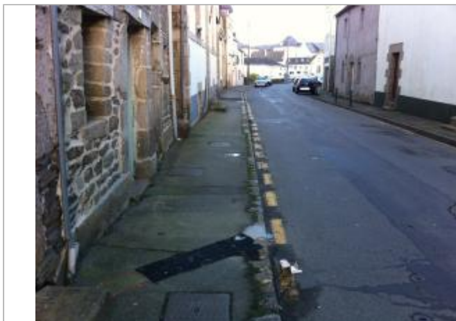
Trottoir 42 RUE DES MOULINS

Coordonnées WGS84 : X: -2.96983400 / Y: 48.06975920