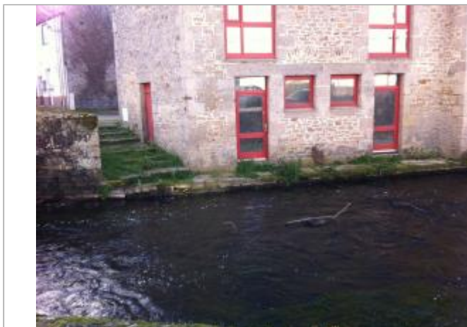
Façade du bâtiment

Coordonnées WGS84 : X: -2.96883560 / Y: 48.07063300