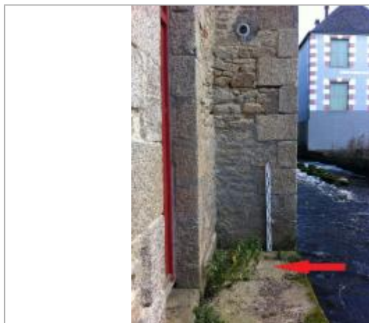
Sol au droit du mur.

SOURCE DE REPÉRAGE : CAMPAGNE DE TERRAIN DHE 2015 - 26/02/2015