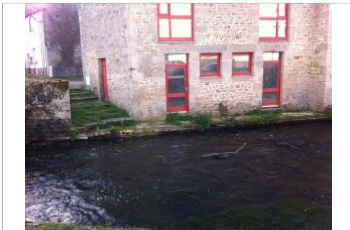
Façade du bâtiment