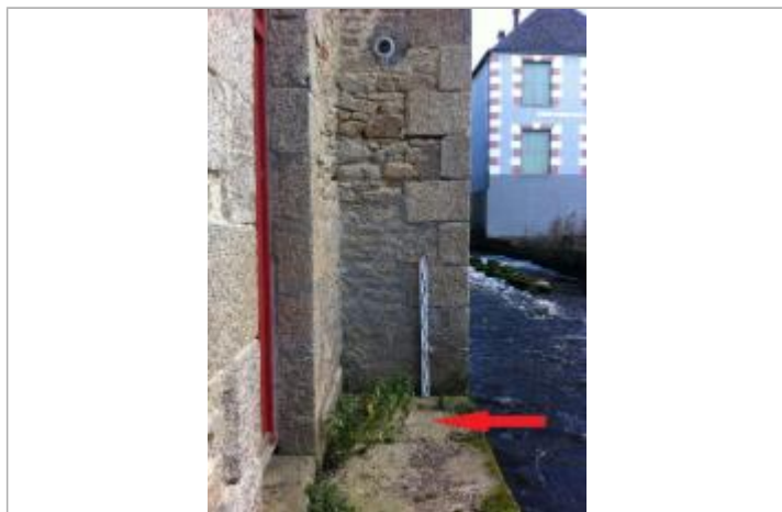
Sol au droit du mur.

Altitude calculée de l'eau (en m) : 56.035