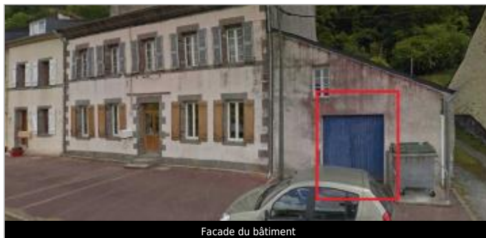
Facade du bâtiment

Coordonnées WGS84 : X: -4.07411900 / Y: 48.21243420