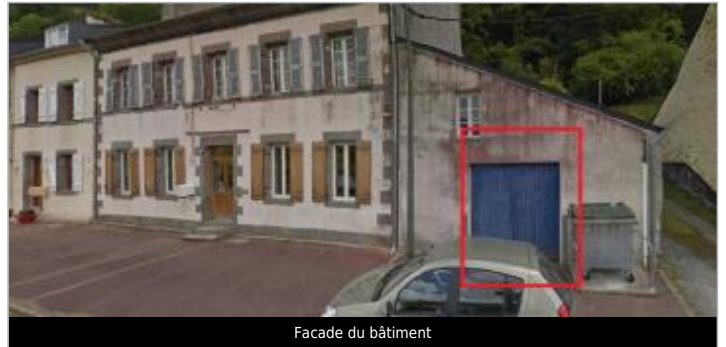
Facade du bâtiment

Coordonnées WGS84 : X: -4.07411900 / Y: 48.21243420