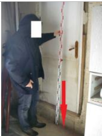
Sol garage - au droit de la porte intérieure donnant dans le garage

Altitude calculée de l'eau (en m) : 6.31