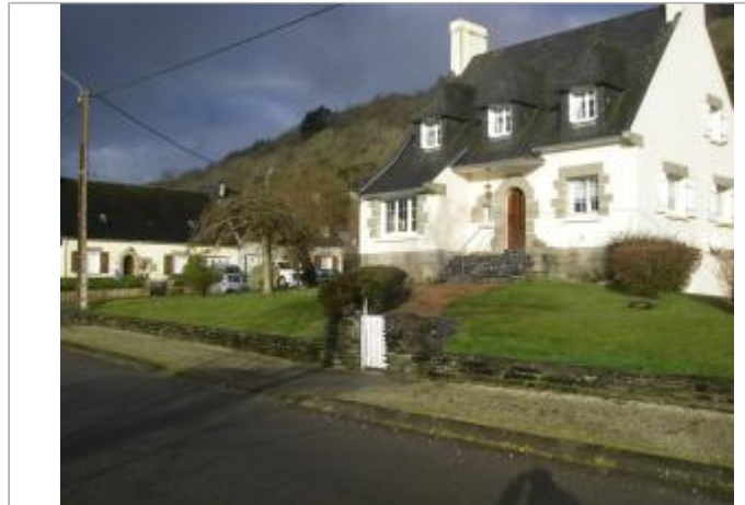
Facade du bâtiment d'habitation

Coordonnées WGS84 : X: -4.08353940 / Y: 48.21705650