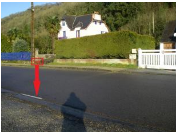
Sol voirie - limite bande de roulement et bas côté le plus proche de la rive - face au 6 bis

Altitude calculée de l'eau (en m) : 4.8 m