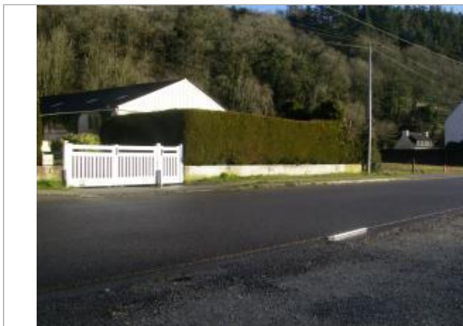
vue d'ensemble 6, BIS QUAI HAIS

Coordonnées WGS84 : X: -4.08131250 / Y: 48.21732230