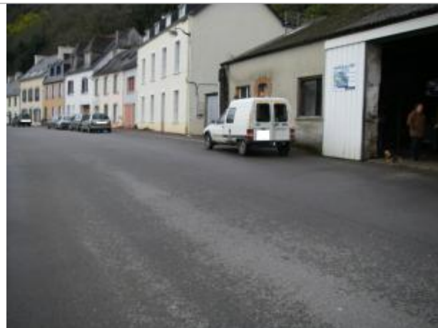
Vue d'ensemble du garage du port