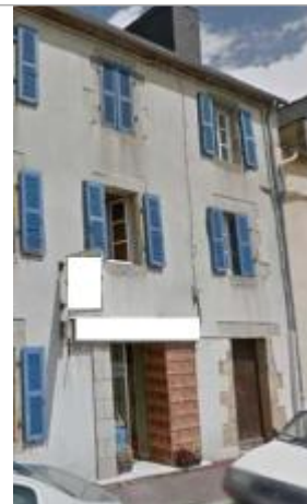
Devanture de la boulangerie