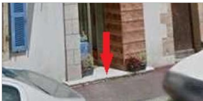
Seuil de la porte du magasin

SOURCE DE REPÉRAGE : CAMPAGNE DE TERRAIN DHE 2015 - 26/02/2015