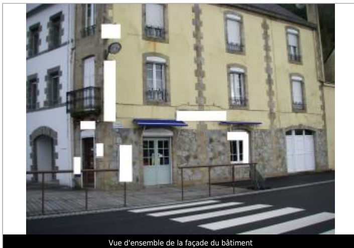
Vue d'ensemble de la façade du bâtiment