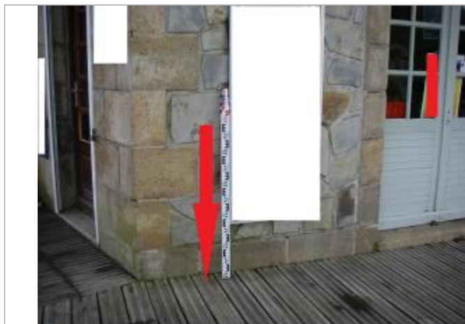
Sol = pied du mur

Altitude calculée de l'eau (en m) : 5.51