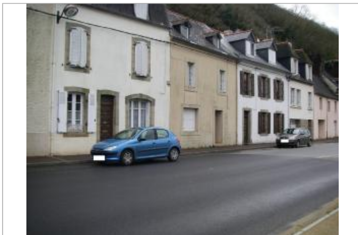
Facade du bâtiment d'habitation