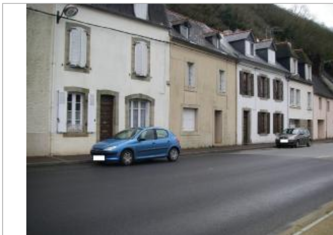
Facade du bâtiment d'habitation

Coordonnées WGS84 : X: -4.07343190 / Y: 48.21454200