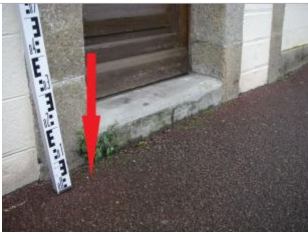
Sol du trottoir au droit de la porte de l'habitation

Altitude calculée de l'eau (en m) : 5.5 m