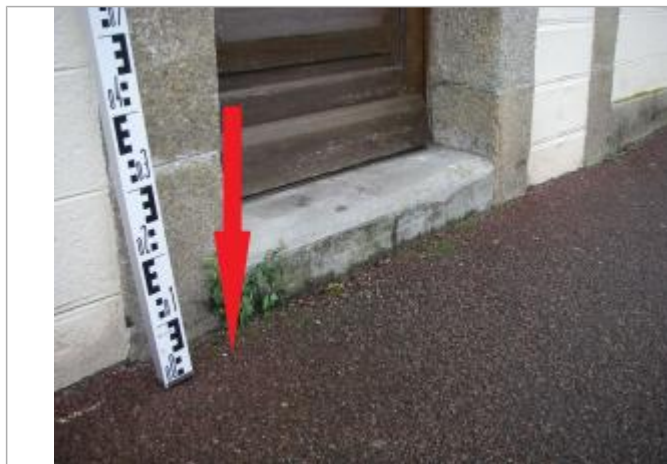
Sol du trottoir au droit de la porte de l'habitation