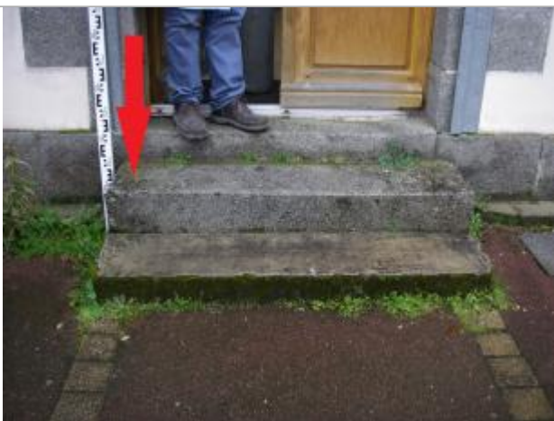
Sous le seuil de la porte d'entrée du bâtiment

Altitude calculée de l'eau (en m) : 5.54