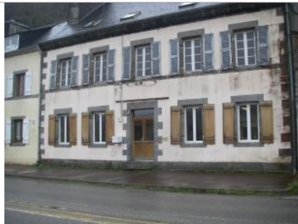
Vue d'ensemble de la façade du bâtiment

Coordonnées WGS84 : X: -4.07407330 / Y: 48.21250220