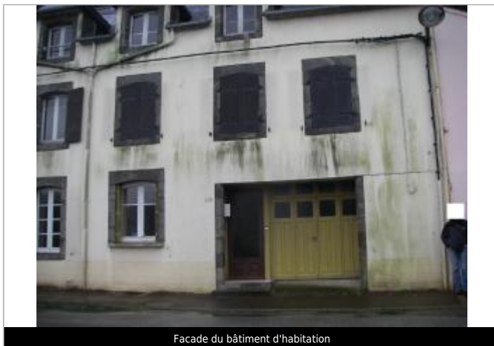
Facade du bâtiment d'habitation