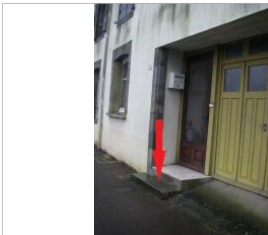
Marche la plus basse devant l'habitation

Altitude calculée de l'eau (en m) : 5.69 m