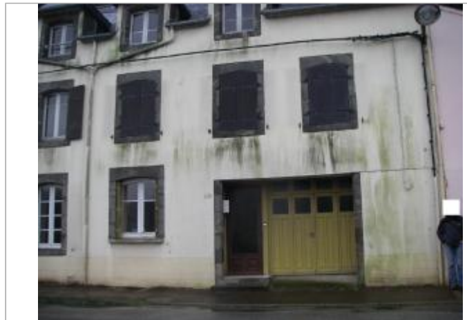
Facade du bâtiment d'habitation