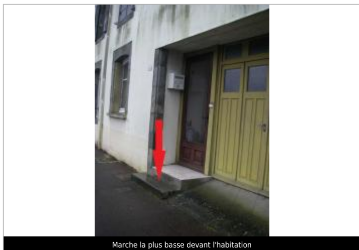
Marche la plus basse devant l'habitation

SOURCE DE REPÉRAGE : CAMPAGNE DE TERRAIN DHE 2015 - 26/02/2015