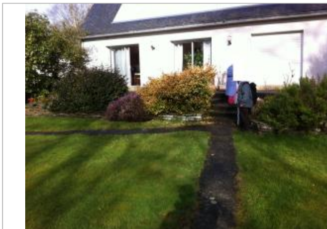
Façade du bâtiment d'habitation