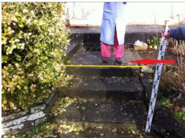
Escalier donnant accès à la terrasse de l'habitation

Altitude calculée de l'eau (en m) : 24.973 m