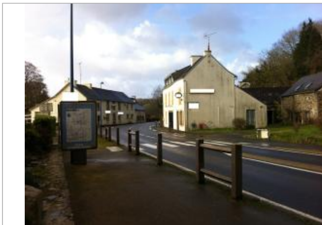
Devanture du bâtiment de commerce