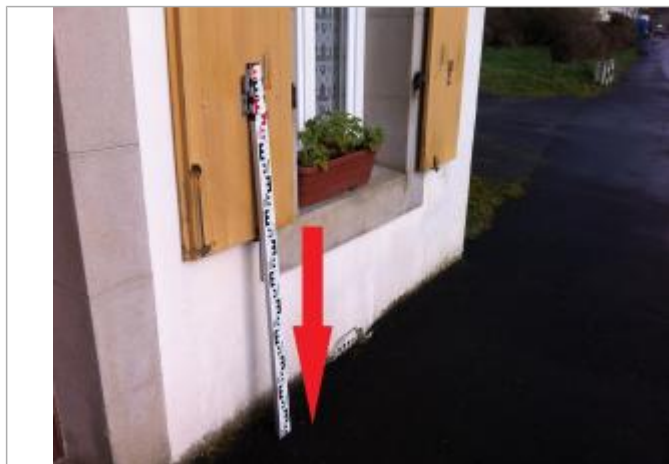
Trottoir au droit de la fenêtre.

Altitude calculée de l'eau (en m) : 25.507