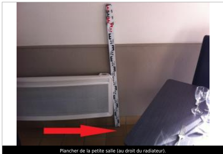
Plancher de la petite salle (au droit du radiateur).

SOURCE DE REPÉRAGE : CAMPAGNE DE TERRAIN DHE 2015 - 26/02/2015