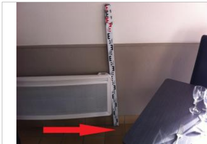
Plancher de la petite salle (au droit du radiateur).

Altitude calculée de l'eau (en m) : 25.169 m