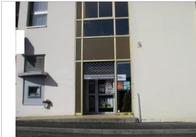
Vue d'ensemble de la façade du bâtiment

Coordonnées WGS84 : X: -4.09118020 / Y: 48.19788650