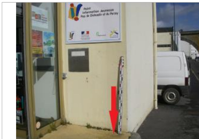
Seuil de la porte d'entrée

Altitude calculée de l'eau (en m) : 7.11