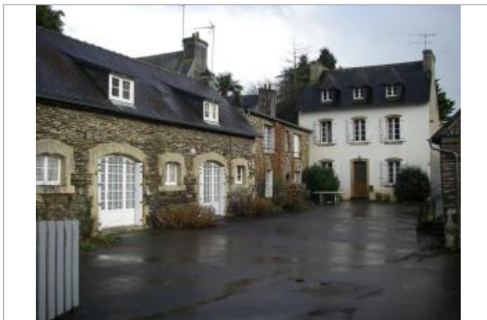
Vue d'ensemble Villa Jouan