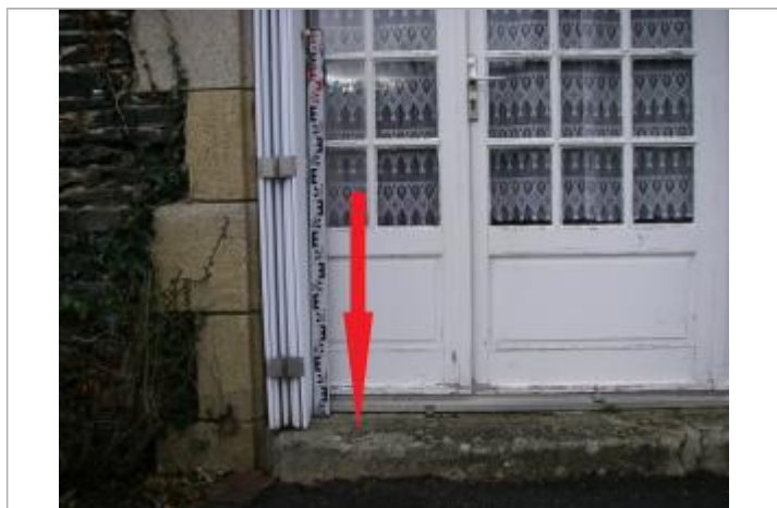
Marche du seuil de la porte d'entrée

Altitude calculée de l'eau (en m) : 7.01