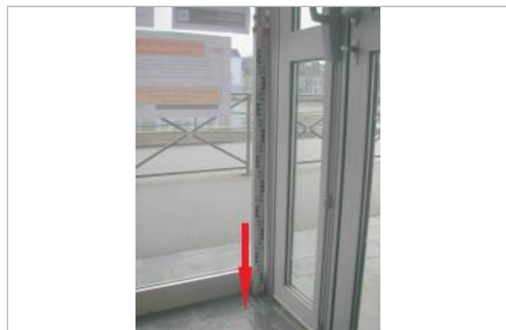
Entrée principale de la maison pour tous

GÉNÉRAL Code : SPC VCB 29026-032 Date de mise à jour : 07/06/2023 Auteur : SPC VCB