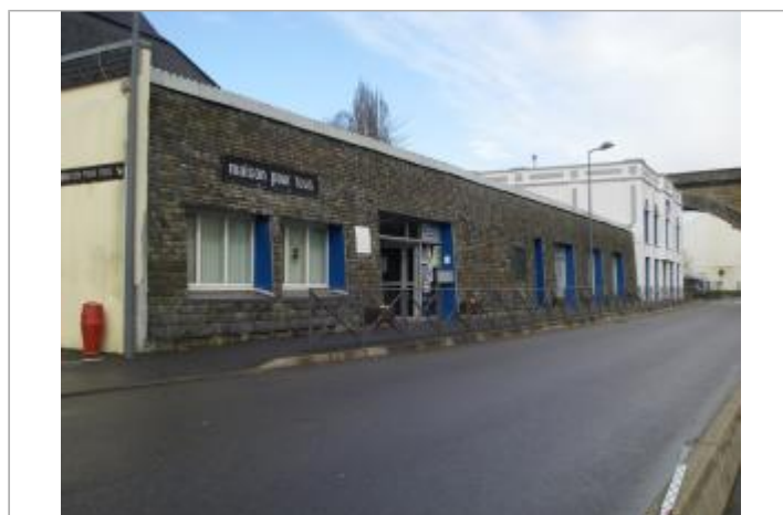
Vue d'ensemble de la façade de la Maison pour tous

GÉOLOCALISATION Coordonnées WGS84 : X: -4.09077150 / Y: 48.19804000 Coordonnées RGF93 (Lambert 93) X: 173857.28 / Y: 6812271.24 Coordonnées RGF93 (ETRS89) : X: -4.0907715 / Y: 48.19804 Code Hydro: J3--0180 Rive de référence: Gauche