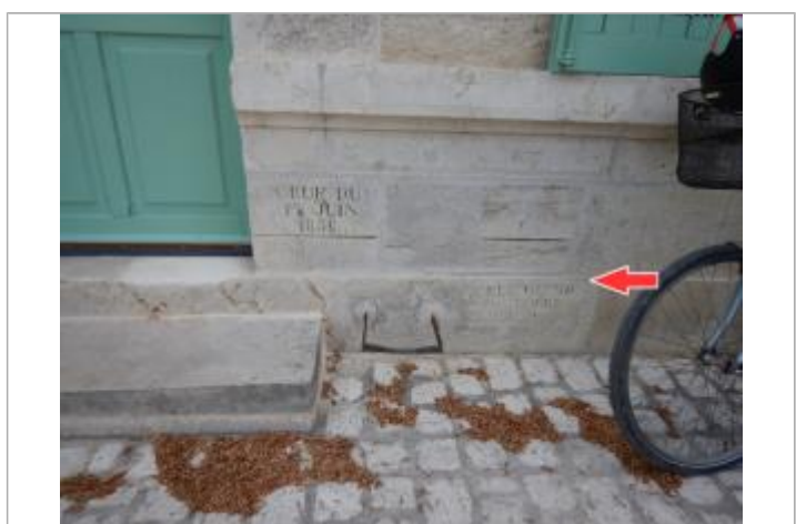
Vue du repère en 2019

MARQUE Texte : CRUE 1866 Maximum de l'inondation : Oui Visibilité : Oui État du repère : Moyen Pérennité : Aucune