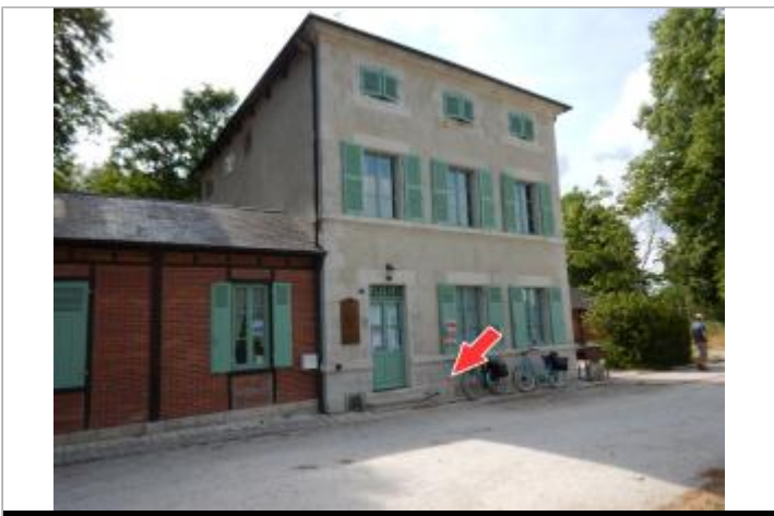
Vue du site en 2019

GÉOLOCALISATION Coordonnées WGS84 : X: 2.76658000 / Y: 47.59159900 Coordonnées RGF93 (Lambert 93) X: 682457.52 / Y: 6721272.68 Coordonnées RGF93 (ETRS89) : X: 2.76658 / Y: 47.591599 Code Hydro: ----0000 Rive de référence: Gauche