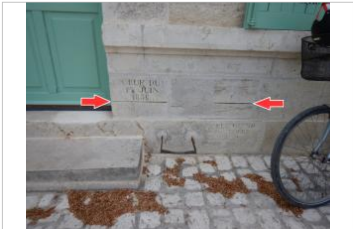
Repère "CRUE DU 1er JUIN 1856" en bon état à gauche et repère "CRUE 1856" abîmé, en 2019

MARQUE Texte : CRUE DU 1er JUIN 1856 Maximum de l'inondation : Oui Visibilité : Oui État du repère : Bon Pérennité : Longue