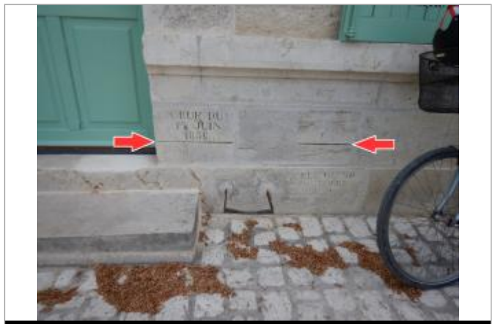
Repère "CRUE DU 1er JUIN 1856" en bon état à gauche et repère "CRUE 1856" abîmé, en 2019

MARQUE Texte : CRUE DU 1er JUIN 1856 Maximum de l'inondation : Oui Visibilité : Oui État du repère : Bon Pérennité : Longue