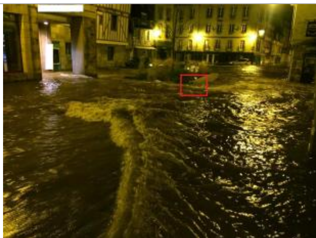
Place Terre au Duc lors de l'inondation à 3h44 le 07/02/2014

Altitude calculée de l'eau (en m) : 4.24 m