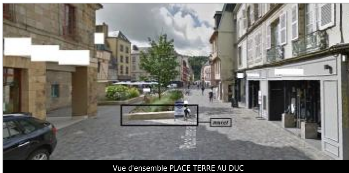
Vue d'ensemble PLACE TERRE AU DUC