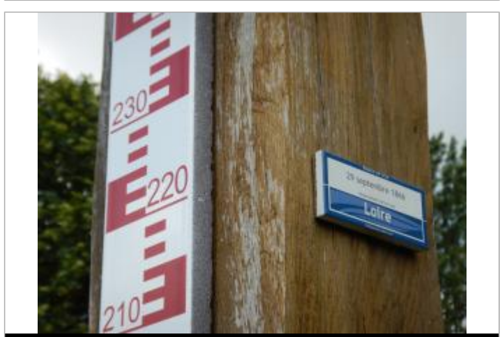
Vue du repère avec l'échelle

MARQUE Texte : Repère de crue - 29 septembre 1866 - Niveau atteint par les eaux - Loire - EP Loire Maximum de l'inondation : Oui Visibilité : Oui État du repère : Bon Pérennité : Longue