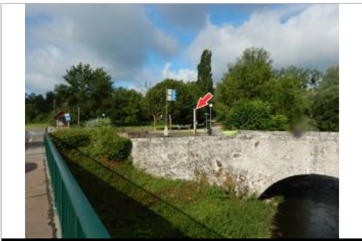
Vue du site depuis le pont de la D751

GÉOLOCALISATION Coordonnées WGS84 : X: 1.25994500 / Y: 47.49391000 Coordonnées RGF93 (Lambert 93) : X: 568998.91 / Y: 6711837.58 Coordonnées RGF93 (ETRS89) : X: 1.259945 / Y: 47.49391 Code Hydro: K4-0220 Rive de référence: Gauche